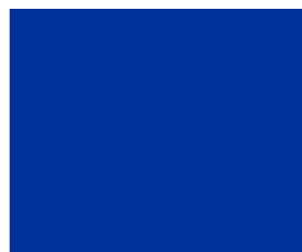
AZUL BRILLANTE 5305