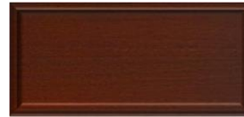
NOGAL OSCURO 8056