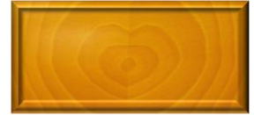
NOGAL CLARO 8055